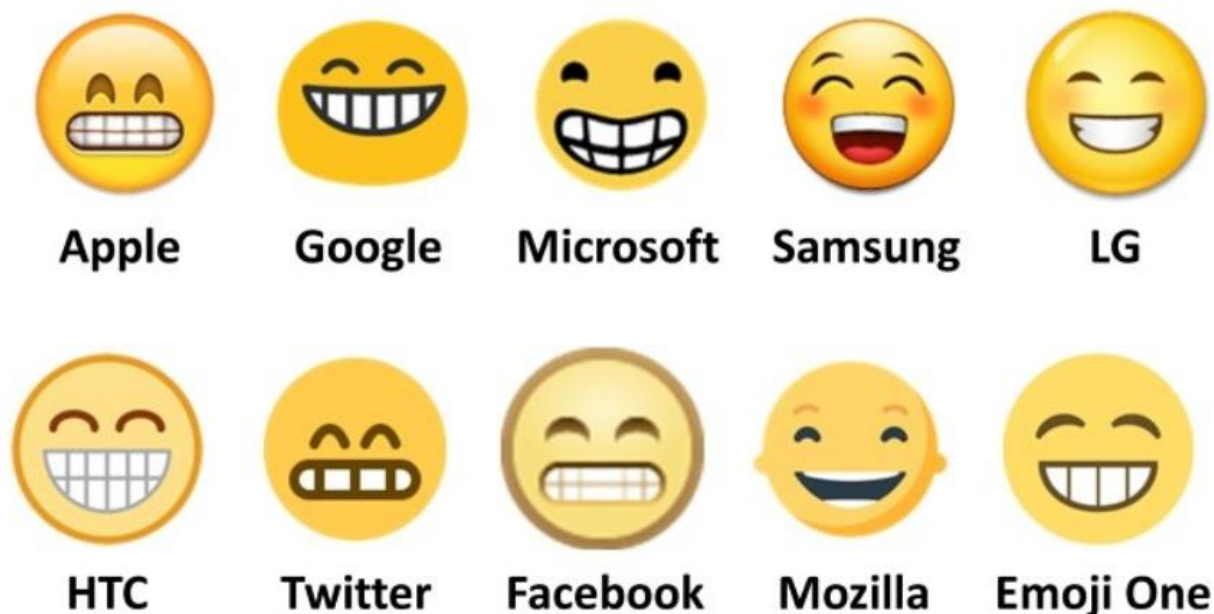
Tabel 2: Forskellige emojis